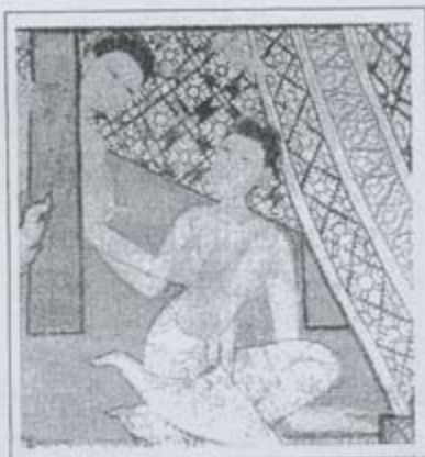
ภาพจิตรกรรมฝาผนัง