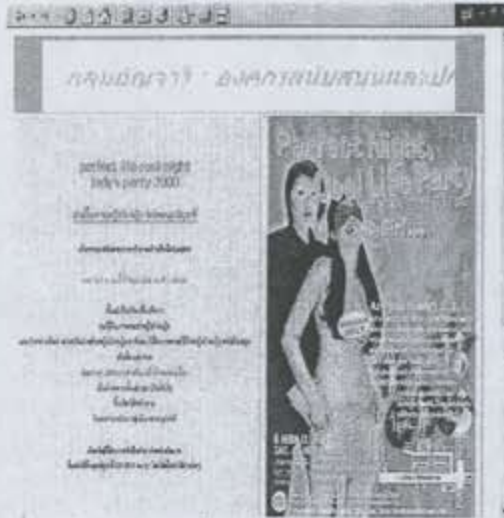
หน้าจอเวปอัญจารีตอนนี้ เห็นเรื่องlady party 2000ของพวกเราละ

นอกจากนั้นยังมี เอ...อะ...อะ... เดี๋ยวขอเปิด เข้าไปดูหน่อยนะ อ้อ...มีสัมภาษณ์ค่ะ สัมภาษณ์น้อง ปิอบอริษา ที่เคยลงในอัญจารีวารไปแล้ว ใครไม่เคย